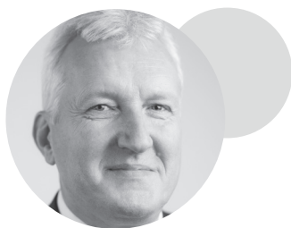
Petr Konvalinka ředitel Technologické agentury ČR

99 Snahou Technologické agentury ČR je podporovat inovativní nápady, které zvyšují konkurenceschopnost naší země a zajišťují lepší budoucnost nás všech. Považujeme tedy za důležité implementovat principy udržitelnosti a cirkulární ekonomiky. Podle expertů je oběhové hospodářství byznys modelem budoucnosti. V Česku ale zatím jeho rozšíření brání zejména levné skládkování a nedostatečná legislativní podpora. Podporu projektů s cirkulární tematikou proto vnímáme jako naši osobní zodpovědnost vůči generacím, které přijdou po nás.