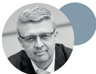
Karel Havlíček vicepremiér pro ekonomiku a ministr průmyslu a obchodu

99 Cirkulární ekonomika je pro průmysl a podnikání v České republice velkou příležitostí i výzvou zároveň. Podmínkou pro zajištění surovinové bezpečnosti je účinné využívání zdrojů, a proto je jednou z priorit Ministerstva průmyslu a obchodu, které zodpovídá za surovinovou politiku státu. Strategické cíle a úkoly v této oblasti stanovuje Surovinová politika ČR v oblasti nerostných surovin a jejich zdrojů a zejména aktualizovaná Politika druhotných surovin ČR.